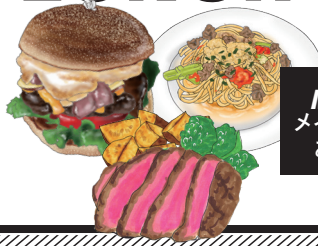
MAIN DISH メインディッシュ 好きな一品