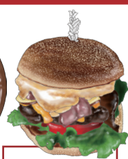
MAIN DISH メインディッシュ お好きな1品