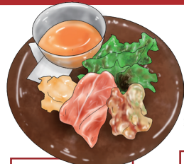
APPETIZER MISTO 前菜盛り合わせ

メインディッシュはお好きなものをチョイス! [税込 1980] コース仕立ての“ニューアメリカン料理”が堪能できるランチコース